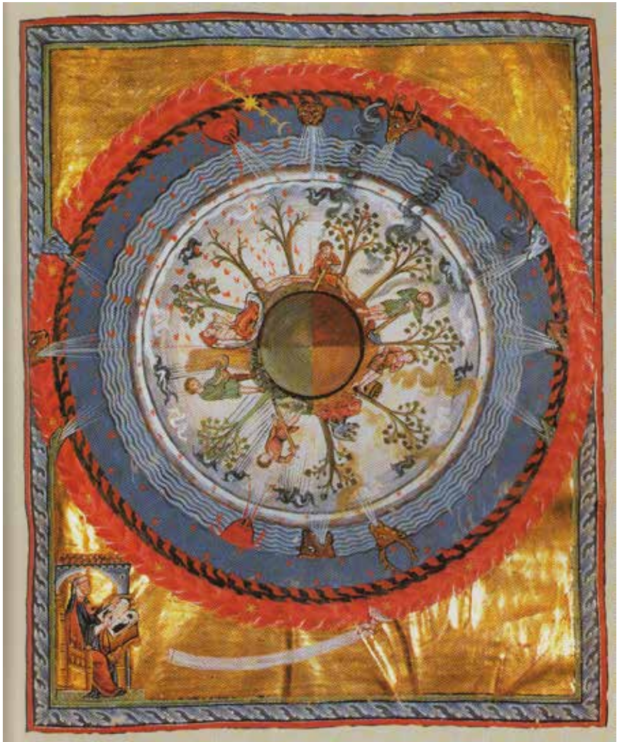
Hildegard von Bingen (1098-1179): Det kosmiske træ