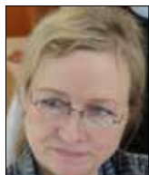
Misser Berg Formand

Bestyrelsen for Jung Foreningen, København: