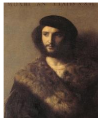
Titian: Luomo malato