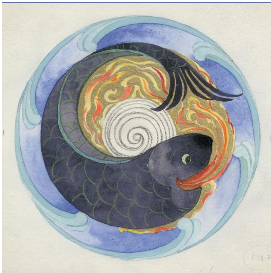
Mandala, malet af en af Jungs patienter

1-årigt grundkursus i Analytisk Psykologi Baseret på Jungiansk teori og praksis