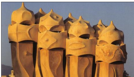
Gaudi, La Pedrera, Barcelona