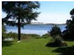
Villa Fjordhøjs have