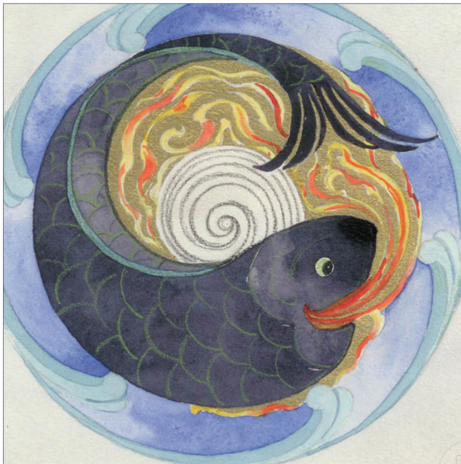
Mandala, malet af en af Jungs patienter

1-årigt grundkursus i Analytisk Psykologi Baseret på Jungiansk teori og praksis