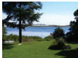
Villa Fjordhøjs have