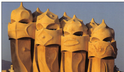
Gaudi, La Pedrera, Barcelona