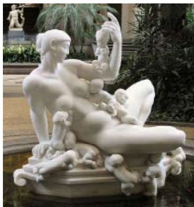
Kai Nielsen, Vandmoderen, Glyptoteket

C. G Jung Institutet København indbyder til en minikonference om tilknytning, arketyper, neuropsykologi og selvets dannelse. Der vil være oplæg af såvel danske som udenlandske foredragsholdere og mulighed for at diskutere i både grupper og plenum. Konferencen foregår på dansk og engelsk.