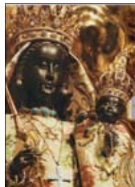
Herover: Den Sorte Madonna fra Einsiedeln

Protestantisk pessimisme: En nærlæsning af Jungs >Svar til Job< med links til Max Horkheimer, T.W. Adorno, Martin Buber og Gabriel Marcel’s ”Renouveau catholique”.