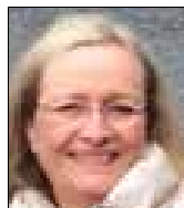
Misser Berg Formand

Bestyrelsen for Jung Foreningen, København.