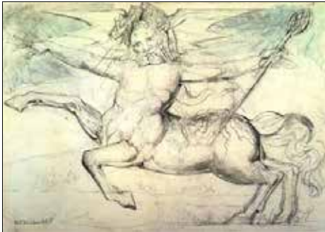
Centaur by William Blake, from The Divine Comedy

Grunnlaget for foredraget er mitt avsluttende essay på utbildningen til jungiansk analytiker med tittelen “The unbearable. An essay about human suffering and the analytical encounter”. Det handler især om utfordringene jeg fikk i møtet med tre spesifikke klienter jeg har hatt i mine lærlingeår. De utfordret meg på hver sin helt særlige måte, og fikk meg til å tvile på om jeg overhodet var i stand til å utføre det arbeidet jeg var i ferd med å utdanne meg til. Prosessene ga uvurderlig innsikt i hva som fremmer lindring og vekst, og samtidig en dypere forståelse av begrepet The wounded healer. Det kliniske materialet vil stå sentralt i foredraget.