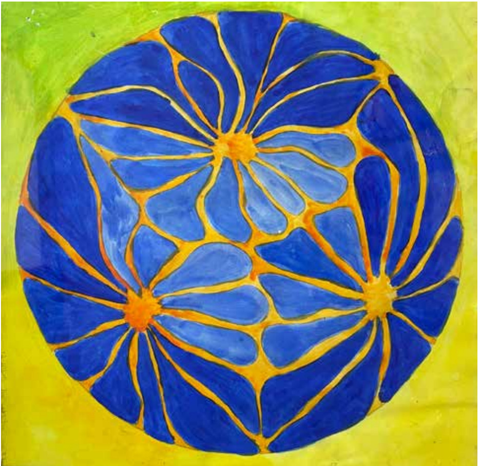
Mandala af Cathrine Lervig, www.volapyk.dk