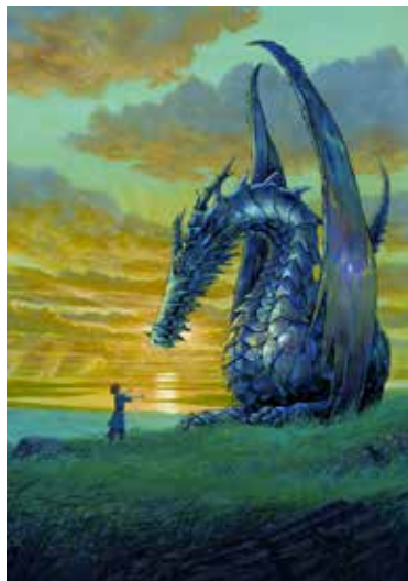
Billedet th: Fra Goro Miyazakis film Legenden om jordhavet

Jeg er i en middelalderby. Jeg sniger mig ind i et hus, hvor der bor en drage, der har fanget en ung kvinde. Jeg kommer for at redde hende. Dragen vågner og forfølger os. Den er enorm. Vi flygter ned i nogle kirkeruiner, der går ned i jorden som huler. Dragen kommer efter os og graver sig gennem ruinerne. Så kommer vi ind i en kirkesal, hvor en kvindelig præst taler for en større forsamling. Hun har lyse klæder, måske hvidt med et mønster af guld, og lysebrunt hår. Dragen braser ind. Med nogle få ord overvinder eller pacificerer hun dragen.