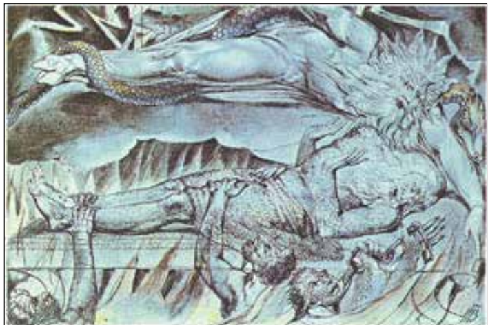
Herover: William Blakes illustration til Jobs Bog

Pris: Kr. 450,- for alle 5 aftener. Kun for medlemmer