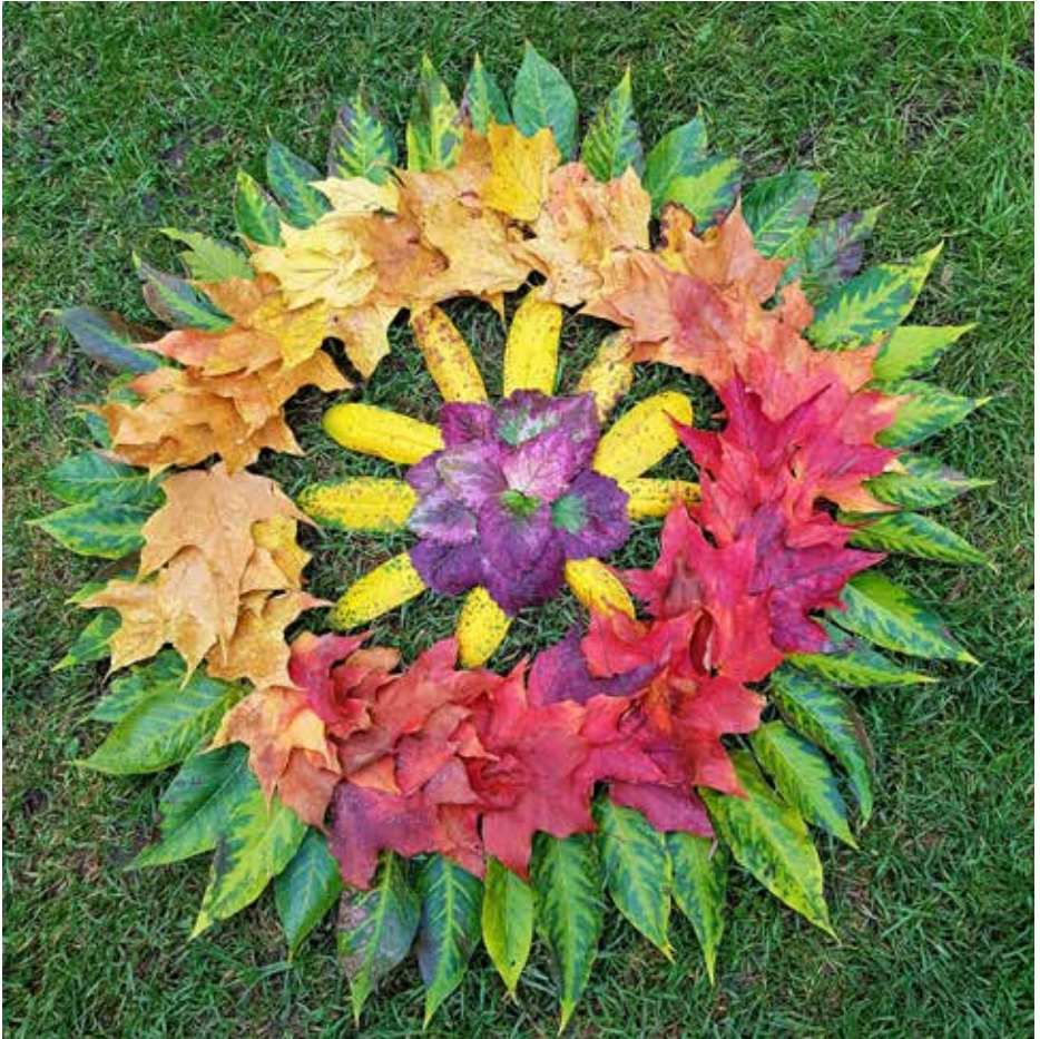
Mandala af Nina Baum